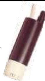
Bomba Niagara 12 V