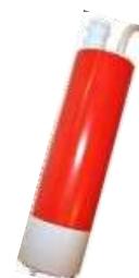
Bomba Amazon 12 V